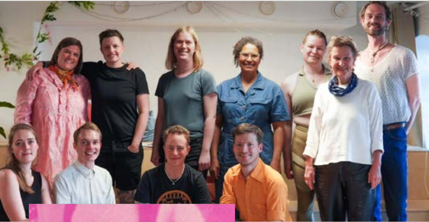
LGBT+ DANMARKS BESTYRELSE | 2023